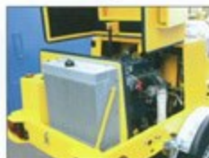
Un échangeur de chaleur très efficace