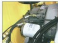
Pompe à débit variable