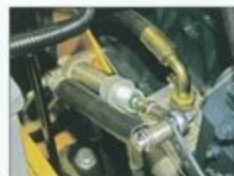
Quand on arrête le pompage, la mise au ralenti du moteur est automatique, ce qui réduit la consommation de carburant et les émissions sonores.