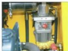
Nettoyeur à haute pression

Avec ses nombreux options comme sa radiocommande, son nettoyeur à haute pression, son compresseur de 400 l/min, son kit de nettoyage, la CLB18 est une machine vraiment unique et une des plus à l'avant-garde sur le marché.