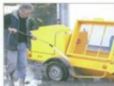
Lavage de la machine

Avec ses nombreux options comme sa radiocommande, son nettoyeur à haute pression, son compresseur de 400 l/min, son kit de nettoyage, la CLB18 est une machine vraiment unique et une des plus à l'avant-garde sur le marché.