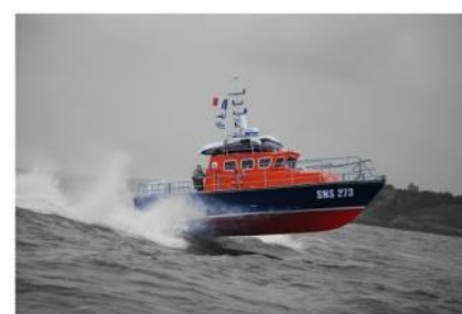
SANT SEUC - LANCIEUX

les courses de chevaux sur la plage de Saint Sieu cet été 2020 à cause de la crise sanitaire. Donc vive les courses de 2021 ! La SNSM a également annulé sa journée festive du 14 juillet 2020, donc vive la fête de 2021 ! Continuons à faire des dons à la station SNSM de Lancieux. La fête du Moulin est également annulée, donc vive 2021 !