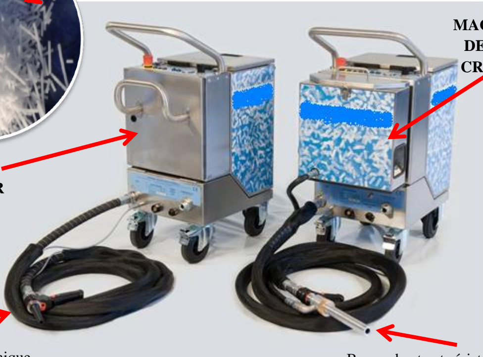
MACHINE DE TIR DE GOMMAGE CRYOGENIQUE