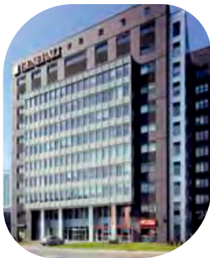
Pilkington Optiphon ™

promis sur ses qualités de transmission lumineuse ou ses capacités de résistance aux chocs.